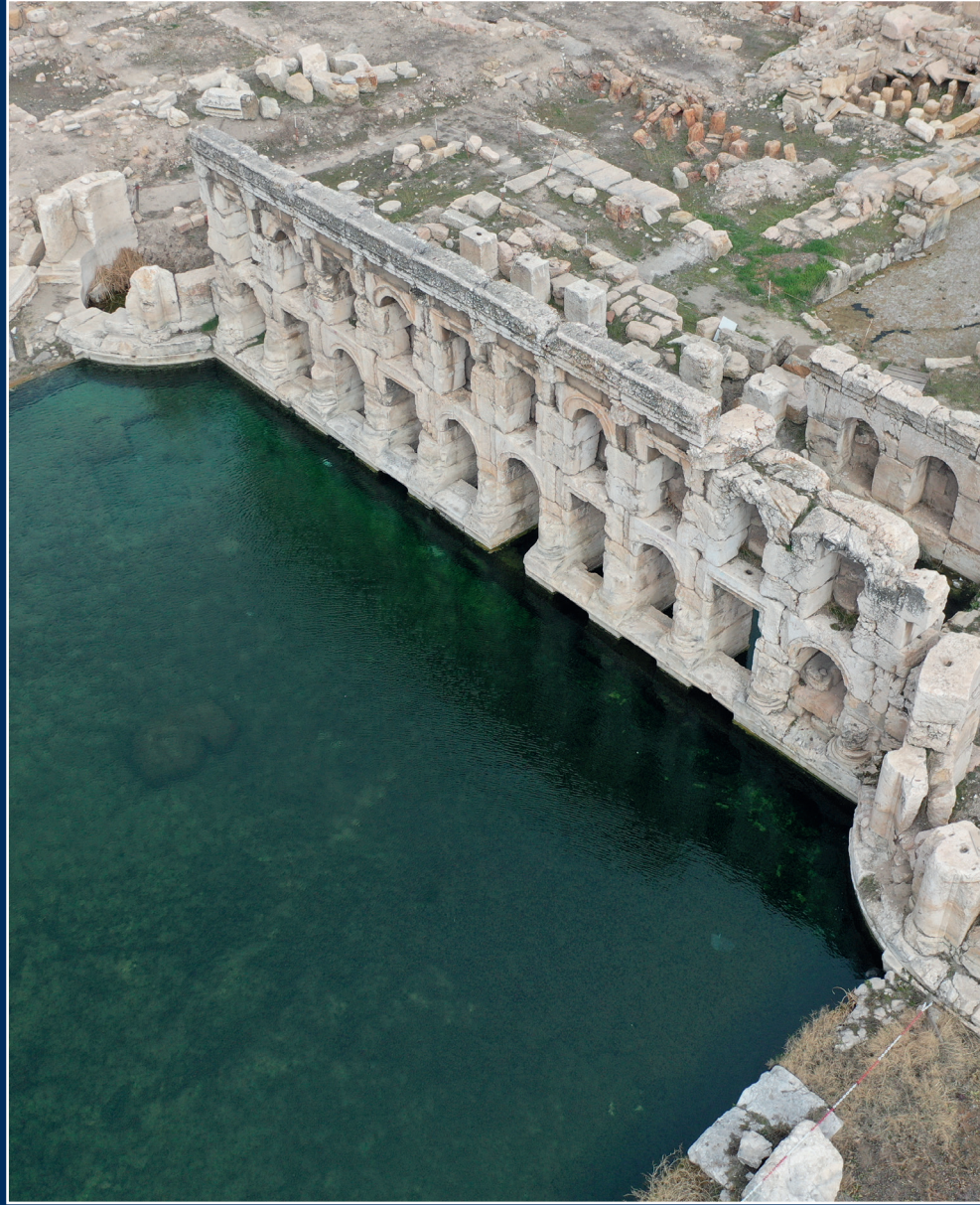
Yozgat Sarıkaya Roma Hamamı, yani Basilica Therma, Sarıkaya İlçe merkezinde yer alır. Basilica Therma, vadinin en çukur yerindeki bu termal kaynağın üzerine yapılmış bir hamam binasıdır. MS 2'nci yüzyılda inşa edilen Roma Hamamı, 19 asırdan beri kesintisiz kullanılmış ve halen de termal suları ile şifa kaynağı olmaya devam etmektedir.