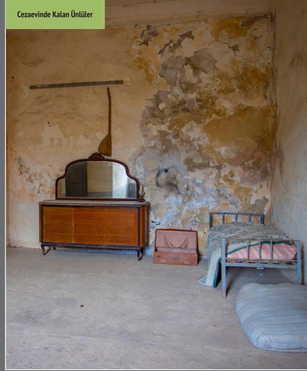
Cezaevinde Kalan Ünlüler

Tarihi Sinop Kapalı Cezaevi, bir dönem "Anadolunun Alkatrazı" tabiri ile de tanınan ve burada yatan ünlüleri ile meşhur cezaevidir. Cezaevi, Sinop Kalesinin iç kısmında eski tersane alanına iki katlı, avlulu üç bölümlü ve "U" planlı olarak 1887 yılında inşa edilmiştir. Yapıda toplam 50 kişi kapasiteli 28 koğuş bulunmaktadır. Yapıya farklı dönemlerde eklemeler ve tamiratlar yapılmıştır. 1999 yılında Kültür Bakanlığına devredilerek açık hava müzesine dönüştürülmüştür.