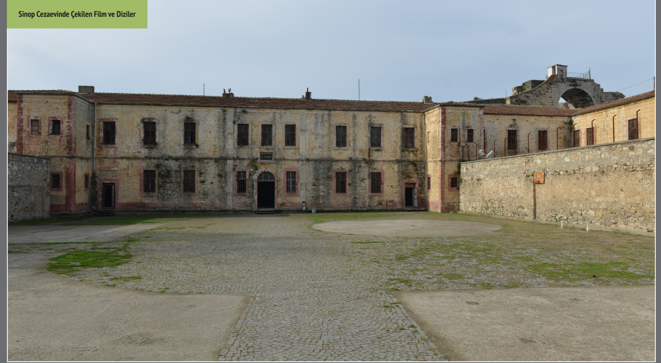
Sinop Cezaevinde Çekilen Film ve Diziler