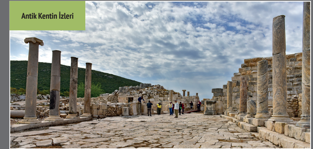
Antik Kentin İzleri

Tüm dünyada Noel Baba adıyla bilinen Aziz Nikolaos ile en çok özdeşleşen yerleşim, piskoposluk yaptığı ve kendi adını taşıyan kilise ile mezarının bulunduğu Demre olmakla birlikte; Aziz Nikolaos'un doğduğu ve hayatının önemli bölümünü geçirdiği yer Patara'dır. Ayrıca Hıristiyanlığın yayılmasında en önemli rollerden birini üstlenen Aziz Paul da Roma'ya gitmek için gemiye buradan binmiştir. Bizans Dönemi'nde piskoposluk merkezi olan Patara'nın önemini gösteren olaylardan biri, Patara Piskoposu'nun Hıristiyanlık açısından belirleyici kararların alındığı İznik Konsili'ne Likya adına katılmasıdır.