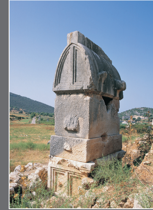
Noel Baba Burada Doğdu

Pers egemenliğinin ardından Büyük İskender tarafından fethedilen, sonraki yıllarda deniz üssü olarak hizmet veren Patara, en parlak yıllarını Roma Dönemi'nde yaşamış; Erken Hıristiyanlığın piskoposluk merkezlerinden biri olmuştur. Ancak ilerleyen dönemlerde salgın hastalıklar, savaşlar nedeniyle nüfusu azalan Patara'yı gözden düşüren etmenlerden biri, yine bir zamanlar gözde bir yerleşim hâline dönüştüren doğadır. En büyüğü 1481'de gerçekleşen depremlere, Xanthos veya günümüzdeki adıyla Eşen Çayı'nın taşıdığı kumlarla binlerce yıl içinde Patara Koyu'nu tamamen doldurması eklenince limanını yitiren kent de önemini kaybetmiş ve kaderine terk edilmiştir.