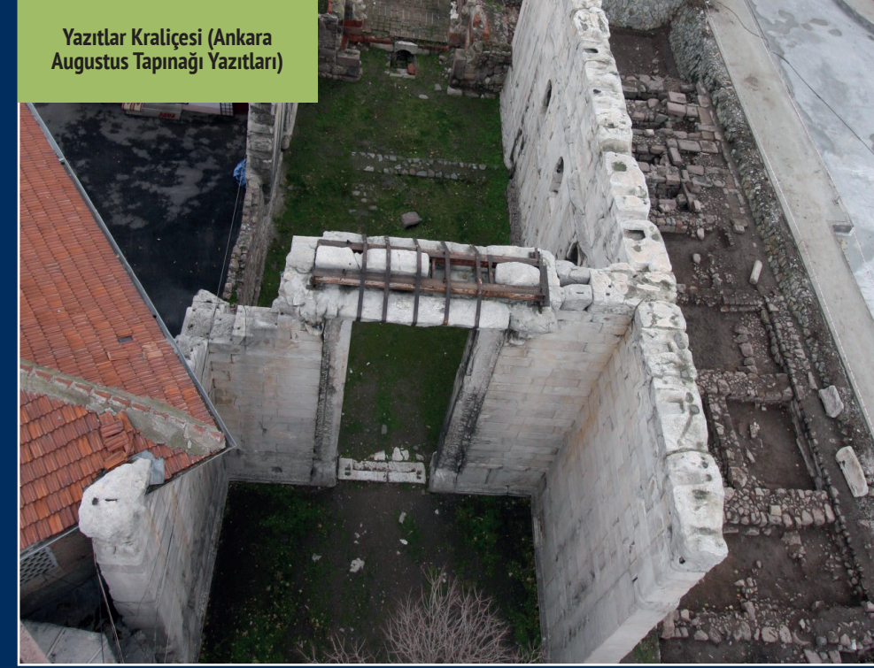
Yazıtlar Kraliçesi (Ankara Augustus Tapınağı Yazıtları)

Ankara'da Roma Dönemi'nin en önemli yapılarından biri olan Augustus-Roma Tapınağı, Galatia eyaletinin İmparator Augustus (MÖ 27-MS 14) tarafından Roma İmparatorluğu'na katılmasından sonra, yeni eyalet merkezi olan Ankyra'da (Ankara) İmparator Augustus ve kentin yerel tanrıçası Roma'ya ithaf edilerek inşa edilmiştir.