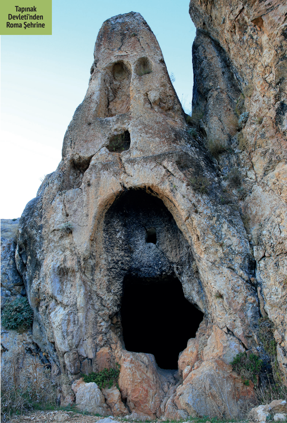
Tapınak Devleti'nden Roma Şehrine

Adana'nın Tufanbeyli ilçesinde bulunan ve uzun süre kutsal bir merkez olarak kabul gören Şar, Adana tarihinde yer eden çok sayıda medeniyetin izlerinin bir arada görülebileceği bir yer. Mevcut kalıntıların büyük bölümü Roma Dönemi'nden olsa da Roma hakimiyeti öncesinde ve sonrasında da hem tapınak hem de yaşam alanı olduğu biliniyor. Şar'ın çok az antik yerleşimde karşınıza çıkabilecek bir özelliği ise günümüzde de bir köy ile iç içe bulunması ve binlerce yıldır aynı noktada yaşamın devam etmesi.