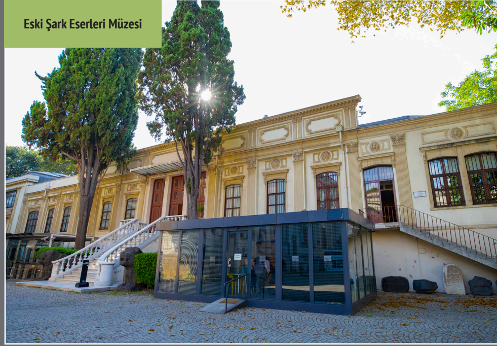
Eski Şark Eserleri Müzesi

1869 yılında Müze-i Hümayun adıyla kurulan İstanbul Arkeoloji Müzeleri'nin ilk binası Aya İrini olsa da İstanbul Arkeoloji Müzesi, Türkiye topraklarında müze olarak inşa edilen ve modern anlamda müzecilik faaliyetlerinin gerçekleştirildiği ilk yer; aynı zamanda müze binası olarak tasarlanan ve kullanılan dünyadaki ilk on müzeden de biri. Dönemin ünlü mimarlarından Alexandre Vallaury'in eseri olan Arkeoloji Müzesi, Türk müzecilik tarihinde atılan en önemli adımlardan. Anıtsal görünümü ve cephe düzenlemesiyle de ziyaretçilerin ilgisini çeken bina 1891 yılında açıldıktan sonra, Anadolu başta olmak üzere bu yıllarda Osmanlı İmparatorluğu'nun hâkim olduğu Kuzey Afrika, Orta Doğu ve Arap Yarımadası, Balkanlar gibi çok geniş topraklarda keşfedilen eserlerin bir araya getirildiği bir yer oldu. Bu bakımdan yalnızca Anadolu ve Türkiye değil, bütün olarak medeniyet tarihine açılan bir kapı olduğunu söylemek kesinlikle abartı olmaz. Görülmesi gereken müzeler listelerinde yer almaya devam etmesi de bunun bir göstergesi.