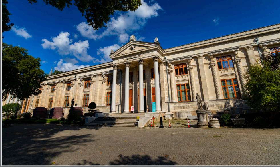
İstanbul Arkeoloji Müzesi

İstanbul Arkeoloji Müzeleri, tarihi aydınlatan eşsiz ve paha biçilmez eserlerin sergilendiği üç ayrı müzeden oluşuyor. Aynı bahçe içerisinde yer alan Arkeoloji Müzesi, Eski Şark Eserleri Müzesi ve Çinili Köşk Müzesi'nin her biri insanlığın binlerce yıllık serüveni içerisinde meydana getirdiği, farklı dönemlere ve kültürlere ait eserleri barındırıyor. Toplam sayıları 1 milyonu aşan bu eserler yanında çeşitli sanatsal ve kültürel etkinliklere de ev sahipliği yapan İstanbul Arkeoloji Müzeleri dünyanın en önemli ve zengin müzelerinden. 1993 yılında Avrupa Konseyi tarafından, "Avrupa'da Yılın Müzesi" ödülüne layık görülmesi ve her yıl milyonlarca kişi tarafından ziyaret edilmesi de öneminin tüm dünyaca kabul edildiğinin kanıtı.