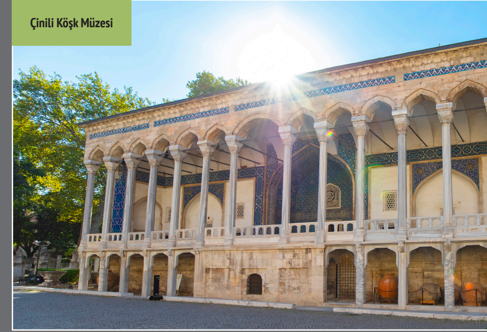
Çinili Köşk Müzesi

Eski Şark Eserleri Müzesi binası 1883 yılında Sanayi-i Nefise Mektebi/Güzel Sanatlar Akademisi olarak Osman Hamdi Bey tarafından Mimar Alexander Vallaury'e inşa ettirimiştir. Yunan egemenliği öncesi Anadolu ve Mezopotamya ile İslam öncesi Mısır ve Arabistan Yarımadası'na ait eserlerin bölgesel sınıflama ile sergilendiği Eski Şark Eserleri Müzesi, uygarlık tarihinin farklı bölgelerde nasıl gelişim gösterdiğini; coğrafyanın sanat ve kültür üzerinde nasıl etkili olabileceğini görebileceğiniz bir yer. Sayıları 75.000'i bulan ve karanlıkta kalan dönemlerin aydınlatılmasına büyük katkı veren çivi yazılı tabletlerin içerisinde en önemlisi dünyanın bilinen ilk yazılı barış anlaşması olarak kabul edilen Kadeş Anlaşması.